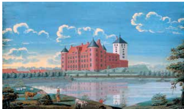
1746 (J.J. Bruun på Skanderborg Museum)

I den sydøstlige fløj af Skanderborg Slot indrettede kong Frederik II i 1572 et slotskapel som afslutning på den omfattende ombygning af den gamle borg, hvis oprindelse strækker sig tilbage til Valdemarstiden. Middelalderborgens hvide tårn stod strategisk godt placeret på øen Slotsholmen og indgik i de senere ændringer frem til 1767.